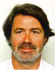
Ronan CREACH COMPAGNIE ARMORICAINE DE NAVIGATION SA Zone Industrielle – BP 65 22260 - PONTRIEUX